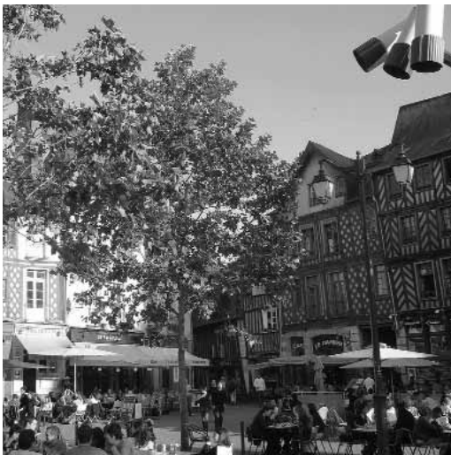
Big Brother watching you!. Foto: Yohann Aberkane