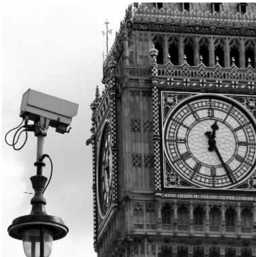
Watching Ben.