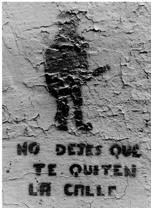
Stencil "No dejes que te quiten la calle".

Si algunas actividades no encajan en el modelo de ciudad homogénea, entran en juego ciertas decisiones políticas que hacen los ajustes pertinentes y necesarios para que la ciudad funcione correctamente, en armonía y convivencia, desactivando aquello que sobra: ruido o suciedad, oposición o vandalismo, mendicidad o prostitución. Es el caso de los discursos de las ordenanzas cívicas y sus normativas sancionadoras. Se dice que son medidas de limpieza, de prevención y de gestión de una nueva complejidad social que debe contrarrestar el uso impropio o inadecuado del espacio público. Hablan en aras de un mayor y mejor uso del patrimonio y la vía pública. Pero sus principios conllevan una ambigüedad que se salvaguarda en nombre de la seguridad y la libertad del ciudadano a comportarse como quiera, dentro de los límites de la normativa. Si alguien pone en duda la iniciativa, desafía al sistema y es penalizado.