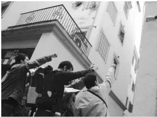
Cámaras de videovigilancia en la calle Santa Ana (Sevilla).