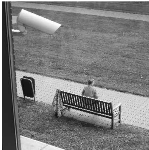
You are being watched. Foto: Daniel Zimmel. Creative Commons by-nc-sa