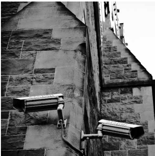
God is watching.