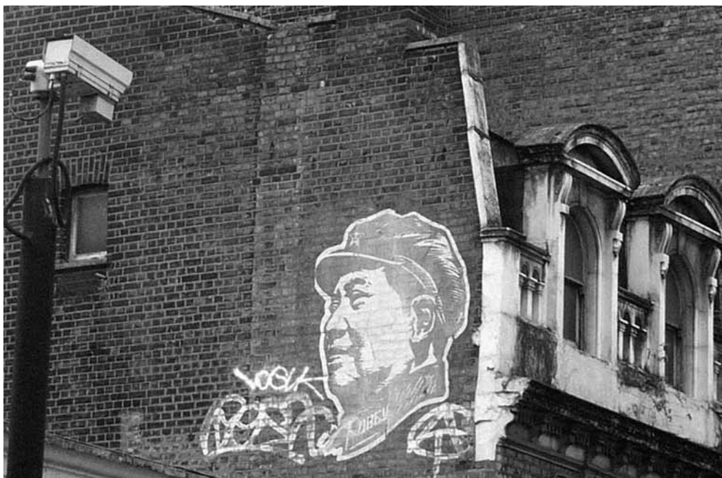
Caught on Camera.

la conferencia episcopal. Este imaginario de lo incontrolado, lo inexorable, lo perverso, lo malvado. Este paisaje desolador y poderosísimo presentado por no se sabe bien quién, pero amplificado por los medios, es el mismo en el que se insertan medidas como la videovigilancia.