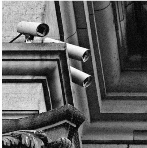
Big Brother.