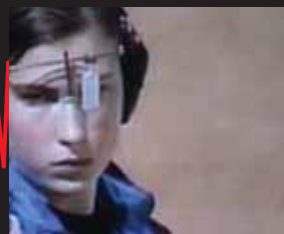
JUAN RAYOS http://www.juanrayos.com/

题目: Field Reports / 指导: Mia Makela (SOLU) / 制作: Solu / 长度: 00:03:45 / 年份: 2004年 / 语言: 无 / 字幕: 无 / 原始播放: / 数据形式: DVD | Betacam / TV系统: PAL | NTSC / 颜色: 彩色 / 多频道: 否 / 声音: 是 / 音轨: 是 / 许可: Copyright