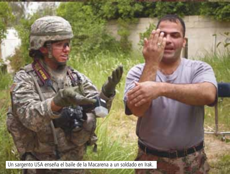
Un sargento USA enseña el baile de la Macarena a un soldado en Irak.