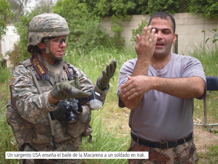
Un sargento USA enseña el baile de la Macarena a un soldado en Irak.