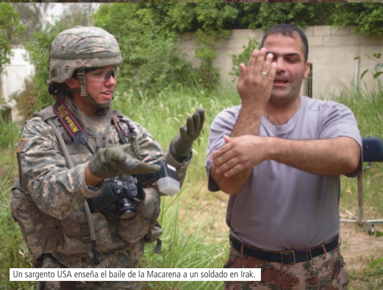
Un sargento USA enseña el baile de la Macarena a un soldado en Irak.